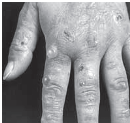
Fot. 2: Porfiria skórna

wystarczy by na twarzy i innych odkrytych częściach ciała powstały ropiejące pęcherze 29 . W odmianie przewlekłej następuje tzw. bliznowacenie, wypadanie włosów (lub rzadziej ich nadmierny wzrost) i pogrubienie skóry w miejscach narażonych na światło. (por. fot.2)