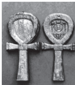
Fot. 4: Symbol Ankh. [Ashmolean Museum, Oxford]

Często symbolem używanym współcześnie przez członków sekt wampirycznych jest krzyż Ankh ( crux ansata ). Znak ten zaczerpnięty został z kultury starożytnego Egiptu, gdzie uznawano go za paginację fizycznego i nieśmiertelnego życia. Symbol ten dawał – poprzez emanowane energii – nieśmiertelność i wieczne zdrowie. W języku starożytnym Kemetu hieroglif ten oznaczał „życie”. Symbol ten został następnie przejęty przez Fenicjan i za ich sprawą stał się znany w świecie semickim. Krzyż Ankh nie jest związany z historią wampirów, został sztucznie zaabsorbowany przez członków sekt. Połączenie to jest dość niefortunne, z uwagi na fakt, iż Ankh powiązany był pierwotnie z kultem słonecznym, od którego przecież „prawdziwy” wampir stroni. (por. fot.4)