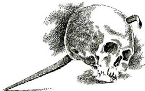
Ryc. 3: Czaszka przebita gwoździem odnaleziona w 1870 roku w okolicach Piotrkowa koło Radomia 22 .

Jedną z dróg eliminacji wampira było zerwanie nadnaturalnego połączenia mary z ciałem zmarłego. Należało jedno z nich zniszczyć, a ponieważ z marą nie można było skutecznie walczyć, zatem odgrzebywano ciała i je palono 23 . W jednej z czeskich kronik z XV wieku zanotowano dwa takie przypadki – w latach 1336 i 1344. Oto jeden z nich: „W Czechach (...) we wsi Blow umarł pasterz. Ten wstając co nocy chodził wokół po wszystkich wsiach, ludzi straszył, dusił i wywoływał. A gdy został kołkiem przebity, mówił szydząc: a to mi bardzo zaszkodziło, bo mi dali łaskę, żebym się mógł psom opędzać! A gdy go odkopali, był wzdęty jak wół i ryczał strasznie. A gdy go rzucono w ogień, ktoś porwawszy kij wbił w niego, i natychmiast trysnęła krew jak z naczynia. Gdy został wykopany i włożony na wóz, ściągnął nogi ku sobie jak żywy, ale gdy go spalono, całe zło ustało” 24 .