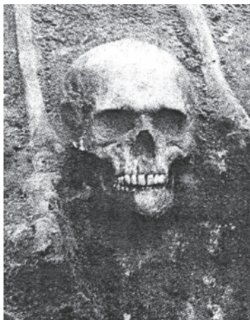
Fot. 1: Grób odnaleziony w Starym Brześciu Kujawskim 18

W Polsce wczesnopiastowskiej panował zwyczaj układania ciała zmarłego w pozycji wyprostowanej na wznak, z głową w kierunku zachodnim. Jednak groby ludzi uznanych powszechnie za upiory różniły się od pochówków zwykłych „śmiertelników”. Ciało ich było ułożone w nienaturalnej pozycji, zdarzało się, że ręce wiązano na plecach. Mogiły takie często zawierały niekompletne szkielety lub przemieszane kości. Prawdopodobnie był to rezultat ćwiartowania zmarłego. Podobnie, w celu uniemożliwienia wampirowi opuszczenia grobu kaleczono mu pięty lub przecinano ścięgna pod kolanami. Najpewniejszym sposobem było jednak obcięcie głowy i umieszczenie jej między nogami, tak aby wampir nie mógł jej uchwycić rękami. Sposób odcinania głowy jest źródłem wierzeń o upiorach niosących własną głowę w rękach. Taki rodzaj pochówku znany jest w Polsce jedynie ze stanowiska w Starym Brześciu Kujawskim. (por. fot. 1)