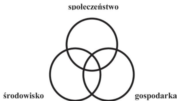
Rys. 1. Trzy filary zrównoważonego rozwoju – opracowanie własne