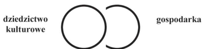
Rys. 2. Dwa filary zrównoważonego rozwoju – opracowanie własne.

Zatem, na zrównoważony rozwój składają się trzy filary: gospodarczy, społeczny i środowiskowy. Z punktu widzenia ośrodka kultury podział ten może wyglądać nieco inaczej. Bowiem przyroda jest fundamentem kultury 6 , również dziedzictwo kulturowe warunkuje istnienie dziedzictwa przyrodniczego 7 . A więc, jeśli mamy na myśli środowisko przyrodnicze zmienione przez człowieka i przyrodę kształtowaną przez człowieka, filar społeczny i środowiskowy będą tożsame. W takim razie, filarami zrównoważonego rozwoju dla ośrodka kultury będą dwa – filar gospodarczy i filar dziedzictwa kulturowego.