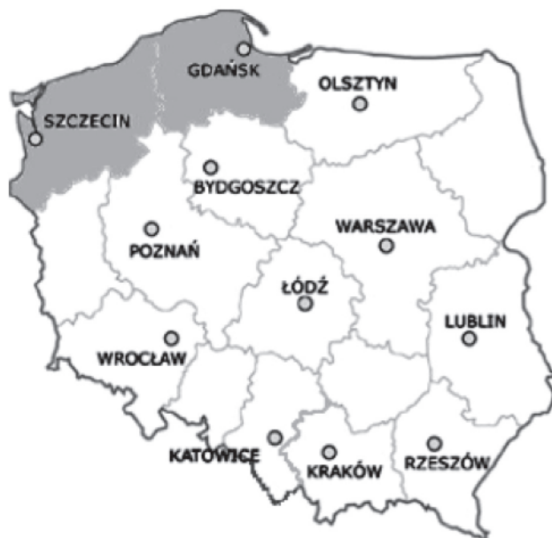
Rys. 1. Region pomorski, w którym prowadzono badania.

Przeprowadzono również jedno spotkanie edukacyjne społeczności lokalnych w Ośrodku Edukacji Ekologicznej w Lipiu – gmina Rąbino, w którym wzięli udział przedstawiciele Związku Gmin Doliny Parsęty, okoliczni mieszkańcy i młodzież szkolna. Oprócz badań ankietowych opracowano na podstawie informacji ze stron internetowych, charakterystykę wybranych gmin w celu oceny ich lokalnej działalności edukacyjnej.